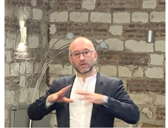
Un conférencier passionné et passionnant...

Bon ! Il conviendrait pour moi de conclure ici ce billet, sinon il excèdera les limites du bulletin (et de votre patience de lecteurs !). Mais que choisir comme clap de fin ? Je ne suis pas inspiré ! Ces histoires d'agents secrets, parfois doubles ou triples, m'ont chamboulé le cerveau ! Tiens ! Je vais vous proposer, pour finir, un petit travail personnel, à rendre au Club une prochaine fois.