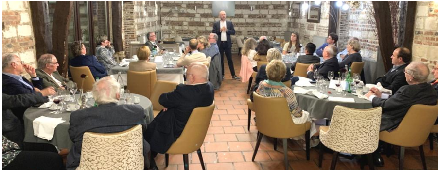
... et un auditoire captivé

Choisissez l'un des deux thèmes suivants :