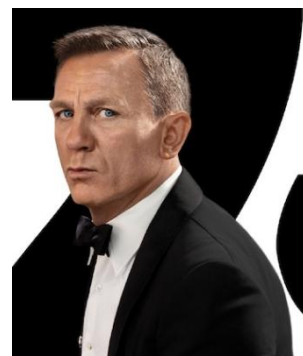
Les trois principaux interprètes de James Bond : Sean Connery, Pierce Brosnan et Daniel Craig